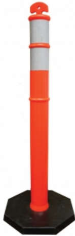
Poste para control de Tráfico