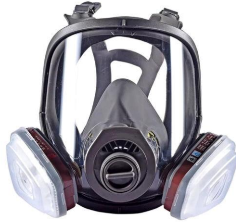
Mascara Full Face con filtro