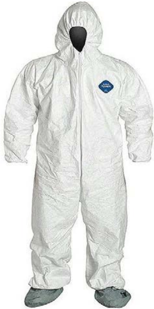
Traje de protección de bioseguridad