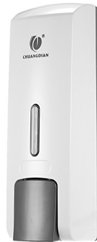
Dispensador de gel antibacterial