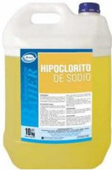
Hipoclorito de Sodio