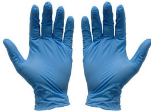
Guantes de nitrilo