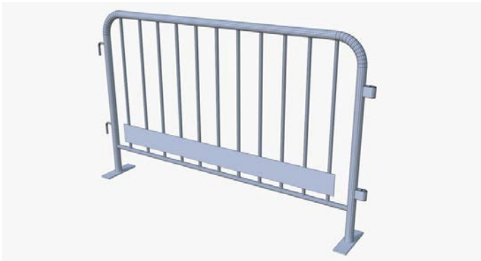
Barrera para el control de multitudes