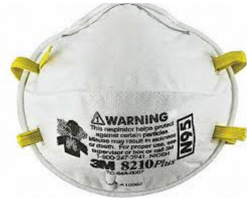
Tapa bocas tipo N95