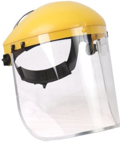
Protector facial de acrílico