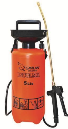
Asperjadora Manual de 5Lts