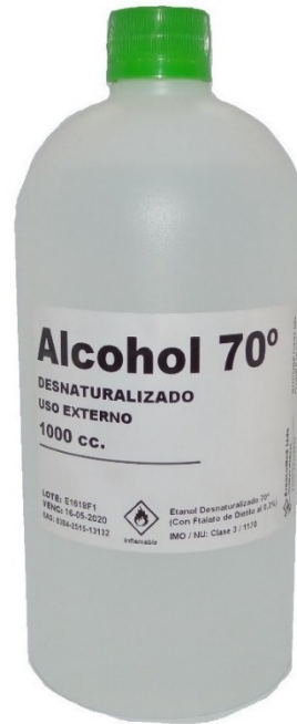
Alcohol al 70%