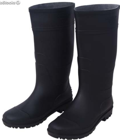
Botas de Caucho