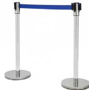
Ordenadores de fila