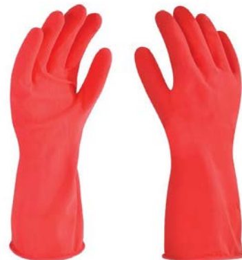
Guantes de Hule